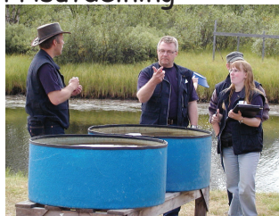
Diamantvaskning i sommartid