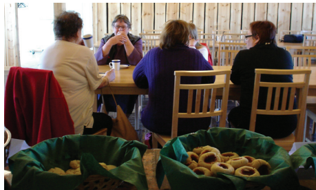
Några damer på blombytdagen