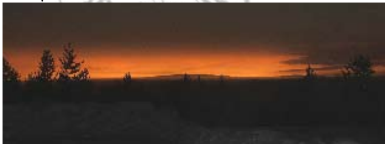
Lannavaara i Midvinternattens underbara sken