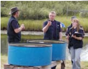
Diamantvaskning i sommartid