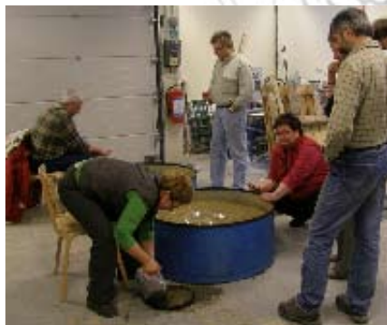
Bilder från inomhus vaskning våren 2007