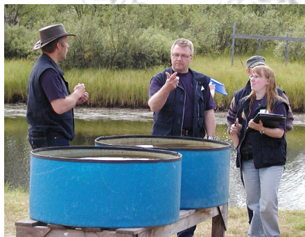
Förberedelser inför Diamantvaskning

Prova på att vaska något så unikt som äkta diamanter, svårare än att vaska guld !!