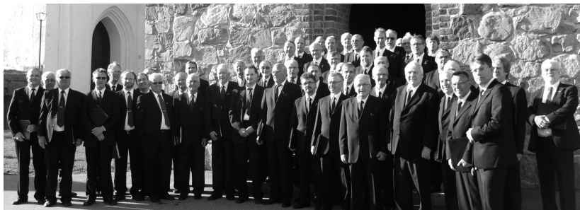
Luleå Gammelstads Manskör efter pingstkonserten i Nederluleå kyrka

28/7 Notdragningen startar kl:11.00 med början vid Filusgården för dem som vill följa med.