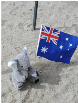
Långväga besökare på SM2006

Utslagstävlingar i guldvaskning Guldgrävarrännnet Hantverksutställningar Mineralträff SGU medverkar och identifierar dina stenar. Guldgrävargudstjänst Diamantvaskning VM i vaskpannekastning ÖNG's Jubileums Tävlning Pub och underhållning till levande orkester