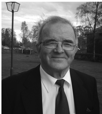
Rune som håller i trådarna för festivalen

Årets festival pågår i en hel vecka, eftersom vi gärna vill dela med oss till andra byar i Östra Kiruna.